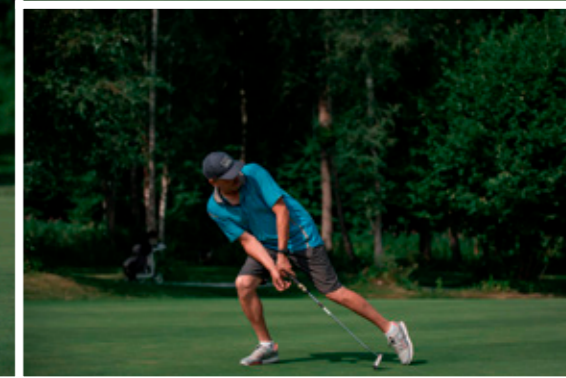
Oli ka sportlikku pingutust – seeria puttamisest