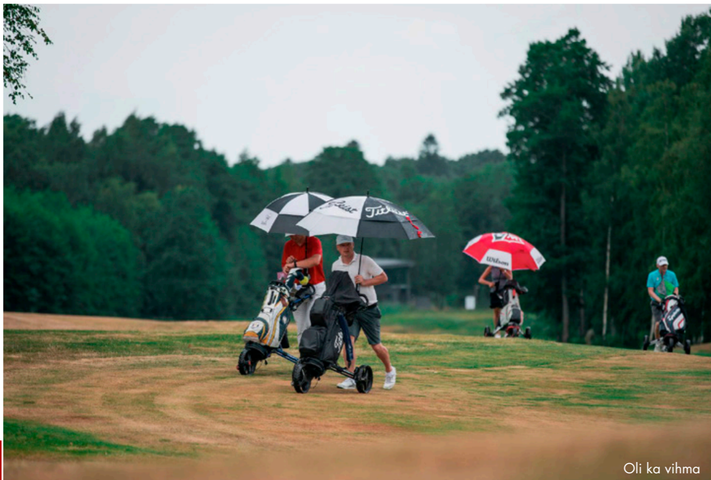
Oli ka vihma